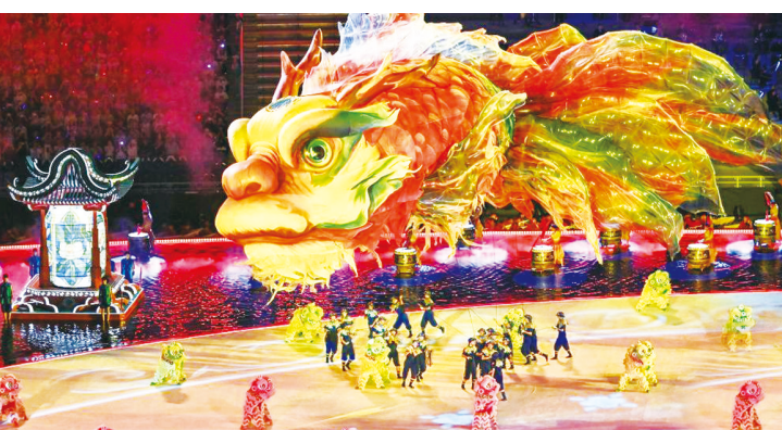
▲演员在开幕式现场表演。

若水’的包容到‘滴水汇海’的团结,主题曲《天海一心》以‘一滴水’为灵感,将竞技体育的激情与人文情怀紧密结合起来。”音乐总设计师舒楠介绍。