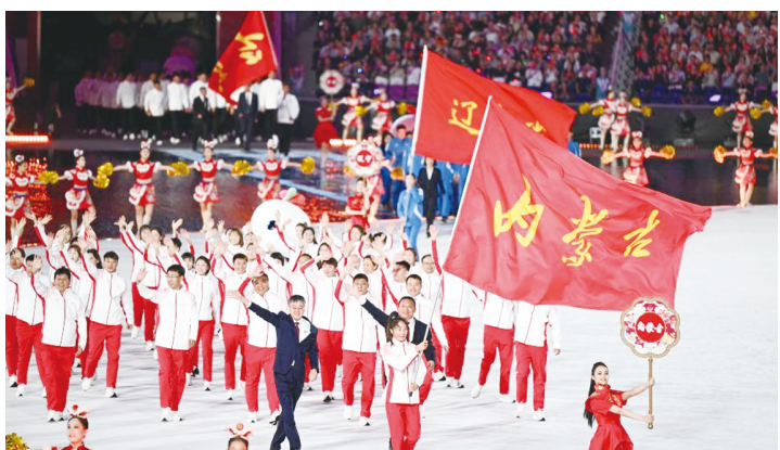
▲内蒙古自治区体育代表团在入场仪式上。

11月9日晚,内蒙古自治区代表团亮相第十五届全国运动会(以下简称“十五运会”)开幕式,杭州亚运会冠军、巴黎奥运会亚军杨柳担任内蒙古代表团旗手。